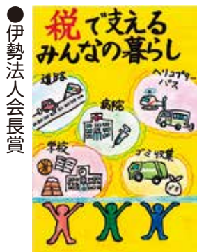
●伊勢法人会会長賞