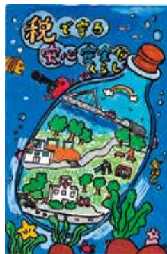
●南勢志摩租税教育推進協議会長賞