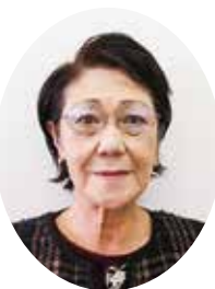
女性部会副部会長