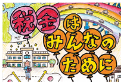
●法人会女性部会長賞