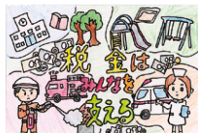
●法人会女性部会税制委員長賞